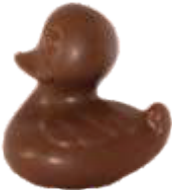
PA056 ■ ■ ■ ■ Ducky 50g - 7cm ↓