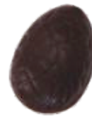
198 ■ 9g - 1,5kg - Framboos crème Crème de framboise Raspberry cream