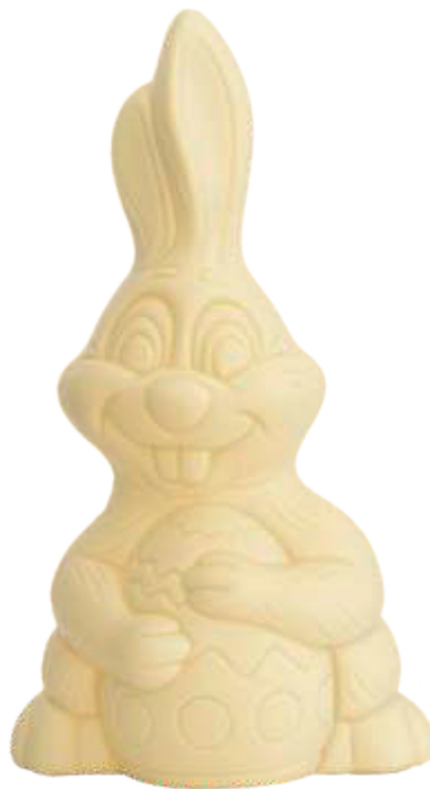
PA023 ■ ■ ■ ■ ■ Ziggy 200g - 24cm ↓