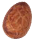
155 ■ 9g - 1,5kg - Hazelnootpraliné Praliné aux noisettes Hazelnut praliné