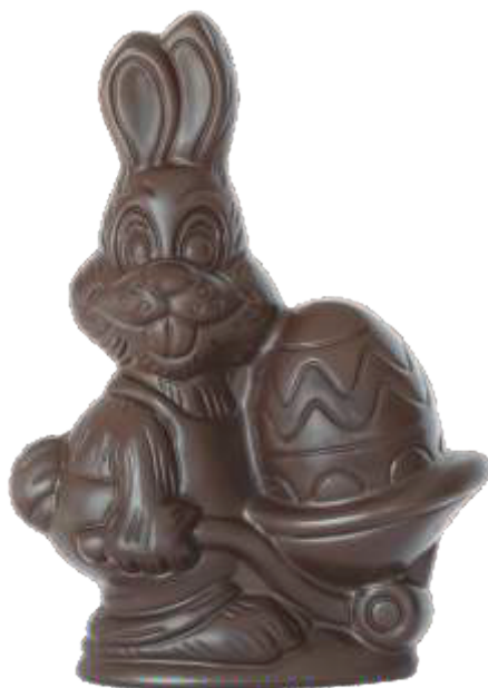
PA027 ■ ■ ■ Theo 200g - 20,5cm ↓