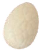
160 ■ 9g - 1,5kg - Pistache crème Crème de pistache Pistachio cream