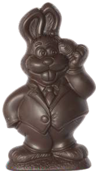
PA026 ■ ■ ■ Cello 200g - 20cm ↓