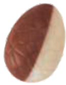
157 ■ 9g - 1,5kg - Domino melk / wit met praliné Domino lait / blanc avec praliné Domino milk / white with praliné