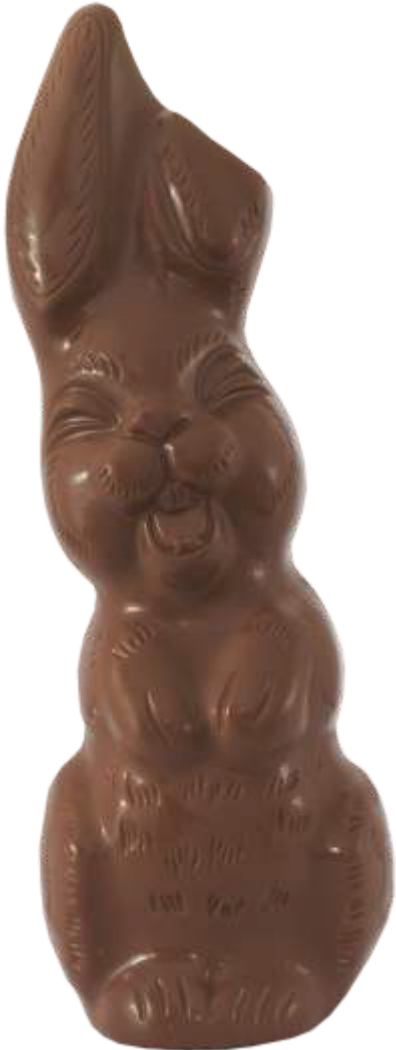
PA120 ■ ■ ■ ■ Robby 120 120g - 17cm ↓ - 2kg