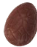
162 ■ 9g - 1,5kg - Karamel Caramel