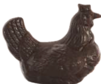
PA051 ■ ■ ■ Chicky 100 100g - 10cm ↓ - 2kg