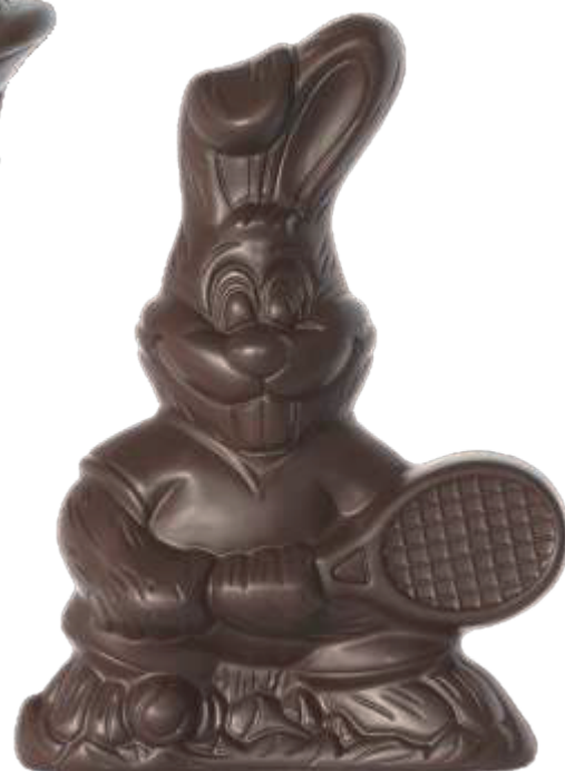
PA028 ■ ■ ■ Tennis 200g - 19cm ↓