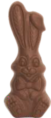
PA021 ■ ■ ■ ■ ■ Flappy 50g - 14cm ↓