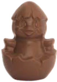
PA054 ■ ■ ■ ■ Calimero 80g - 10cm ↓