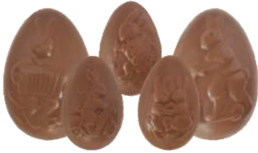
PA001 ■ ■ ■ ■ ■ MIX Easter Eggs Mix 20g / 30g / 45g - 2kg