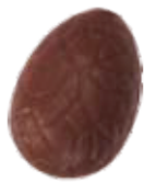
159 ■ 9g - 1,5kg - Praliné krokant Praliné croquant Praliné crispy