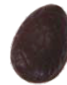
163 ■ 9g - 1,5kg - Fondantchocolade Chocolat noir Dark chocolate