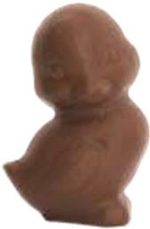
PA055 ■ ■ ■ ■ Tweety 50g - 9,5cm ↓