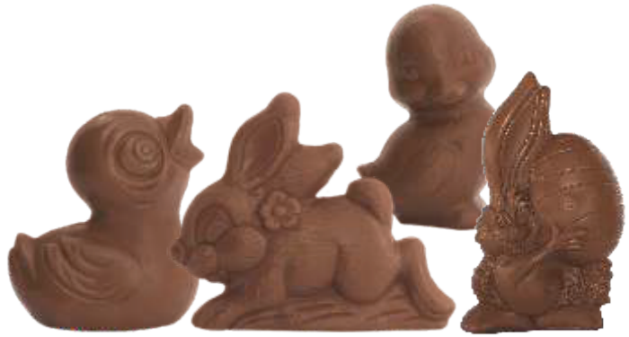
PA003 ■ ■ ■ ■ ■ MIX Easter mix 50g - 2kg