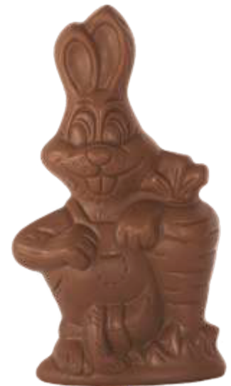
PA025 ■ ■ ■ ■ ■ Wiggle 150g - 18,5cm ↓