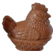
PA050 ■ ■ ■ Chicky 50 50g - 7cm ↓ - 2kg