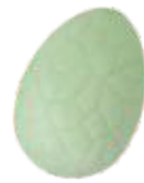
156 ■ 9g - 1,5kg - Krokante witte chocolade met natuurlijk groen Chocolat blanc croquant coloré vert naturel White crispy chocolate with natural green