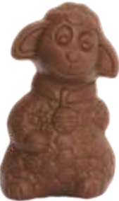
PA065 ■ ■ ■ ■ Mellow 60g - 10cm ↓