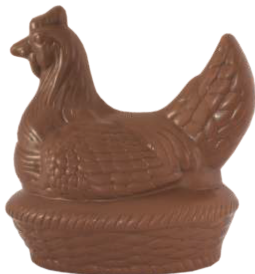
PA052 ■ ■ ■ Chicky 300 300g - 19cm ↓ - 1,2kg