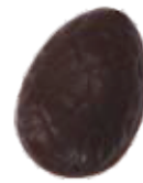
152 ■ 9g - 1,5kg - Hazelnootpraliné Praliné aux noisettes Hazelnut praliné