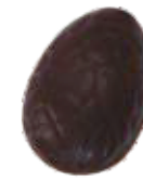
158 ■ 9g - 1,5kg - Praliné krokant Praliné croquant Praliné crispy