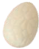
154 ■ 9g - 1,5kg - Hazelnootpraliné Praliné aux noisettes Hazelnut praliné