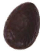
197 ■ 9g - 1,5kg - Koffie praliné Praliné au café Coffee praliné