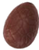
151 ■ 9g - 1,5kg - Vanille crème Crème à la vanille Vanilla cream