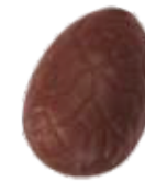
199 ■ 9g - 1,5kg - Banaan crème Crème de banane Banana cream