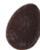
207 ■ NEW 9g - 1,5kg - Banaan crème Crème de banane Banana cream