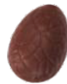
153 ■ 9g - 1,5kg - Hazelnootpraliné Praliné aux noisettes Hazelnut praliné