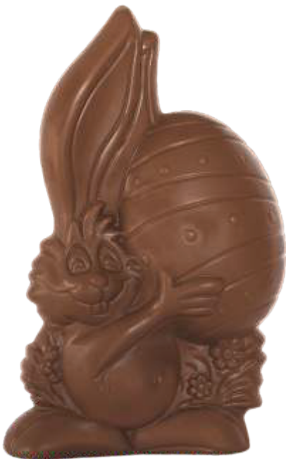
PA022 ■ ■ ■ ■ ■ Happy 250g - 22cm ↓