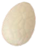
165 ■ 9g - 1,5kg - Witte chocolade Chocolat blanc White chocolate