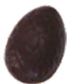
206 ■ NEW 9g - 1,5kg - Pistache crème Crème de pistache Pistachio cream