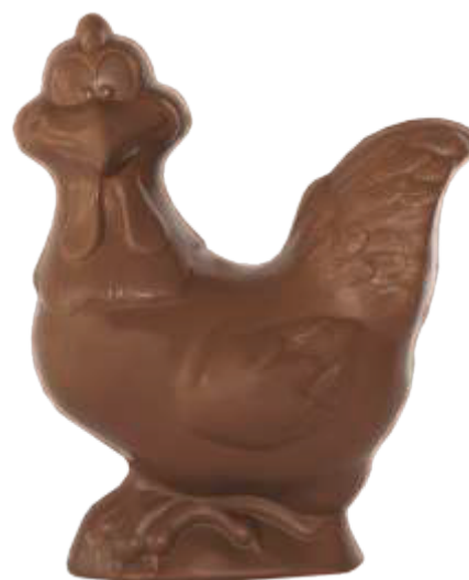
PA053 ■ ■ ■ Yolo 200g - 16cm ↓