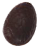
150 ■ 9g - 1,5kg - Vanille crème Crème à la vanille Vanilla cream