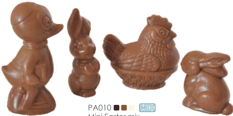
PA010 ■ ■ ■ ■ ■ MIX Mini Easter mix 10g - 1kg