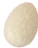
161 ■ 9g - 1,5kg - Advokaat crème Crème d'avocat Egg liqueur cream